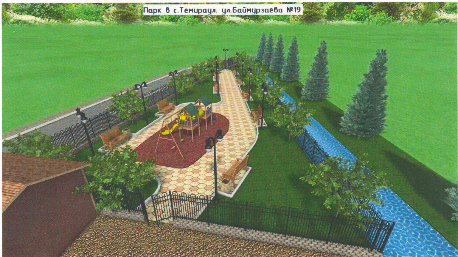
Парк в с. Темираул. ул. Баймурзаева №19