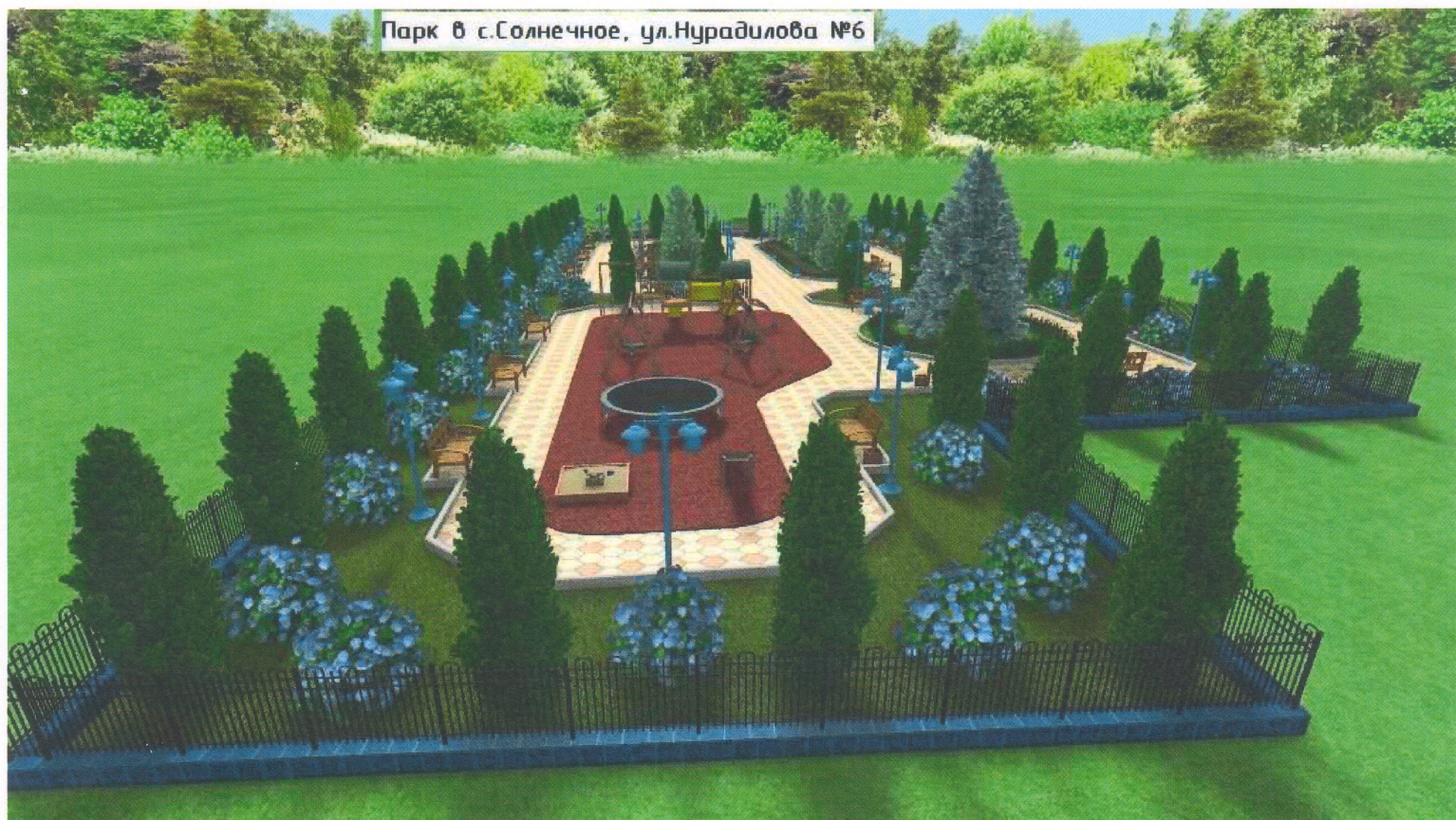
Парк в с.Солнечное, ул.Нурадилова №6