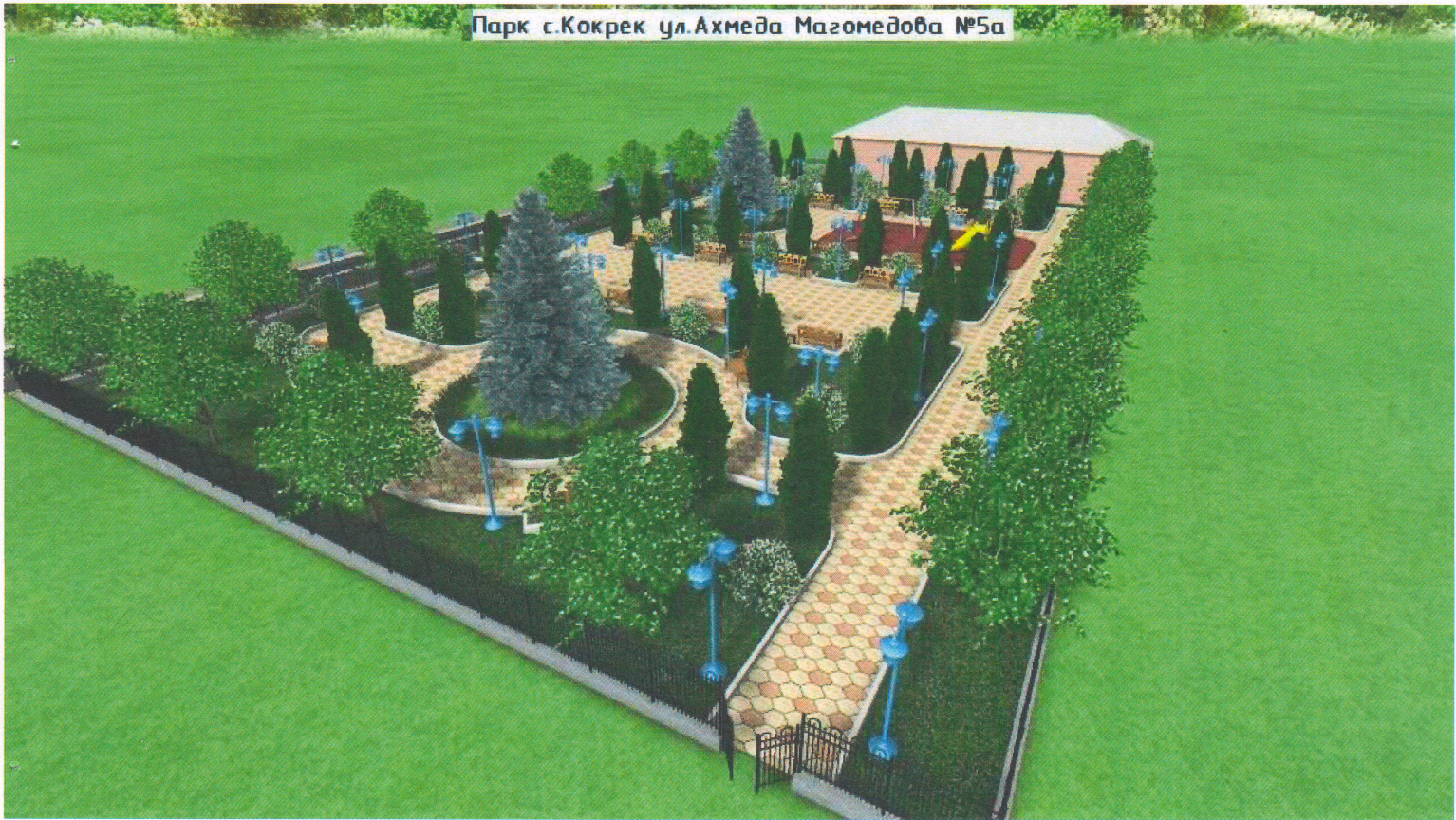
Парк с.Кокрек ул.Ахмеда Магомедова №5а