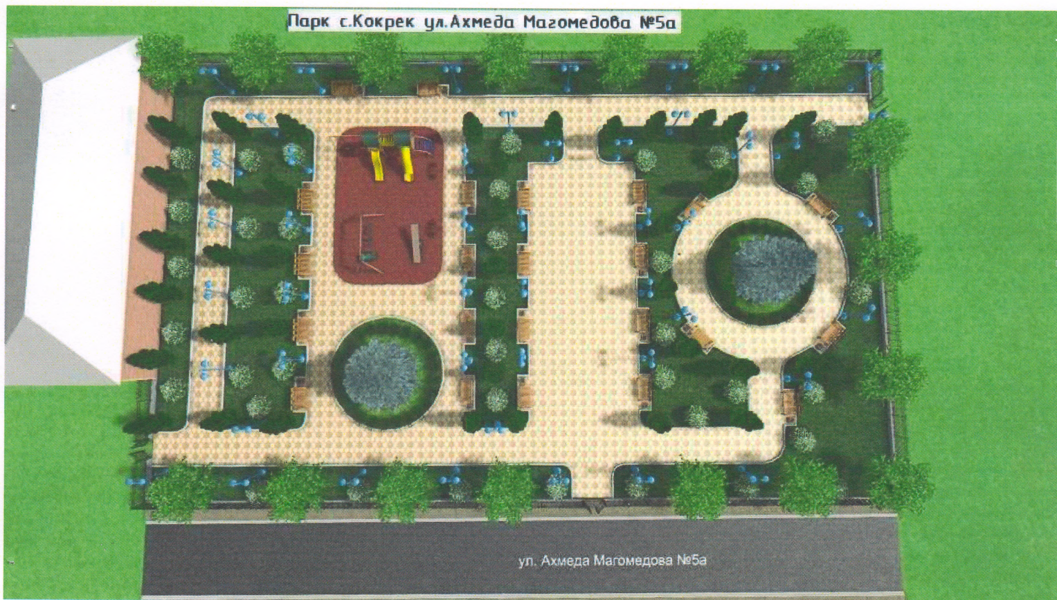
ул. Ахмеда Магомедова №5а