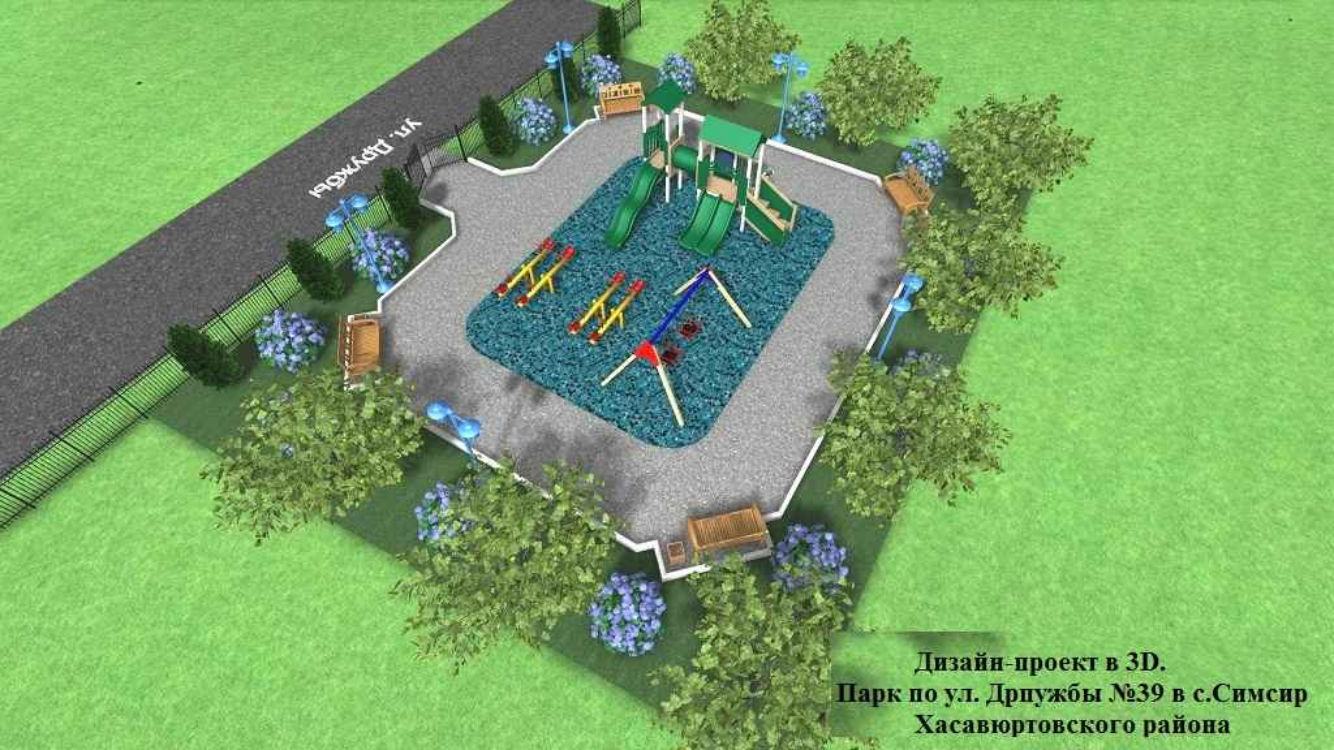
Дизайн-проект в 3D. Парк по ул. Дружбы №39 в с.Симсир Хасавюртовского района