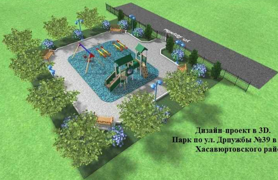
Дизайн-проект в 3D. Парк по ул. Дружбы №39 в с.Симсир Хасавюртовского района