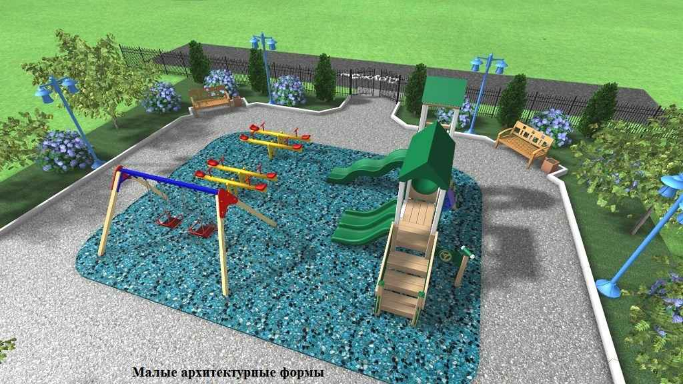
Малые архитектурные формы