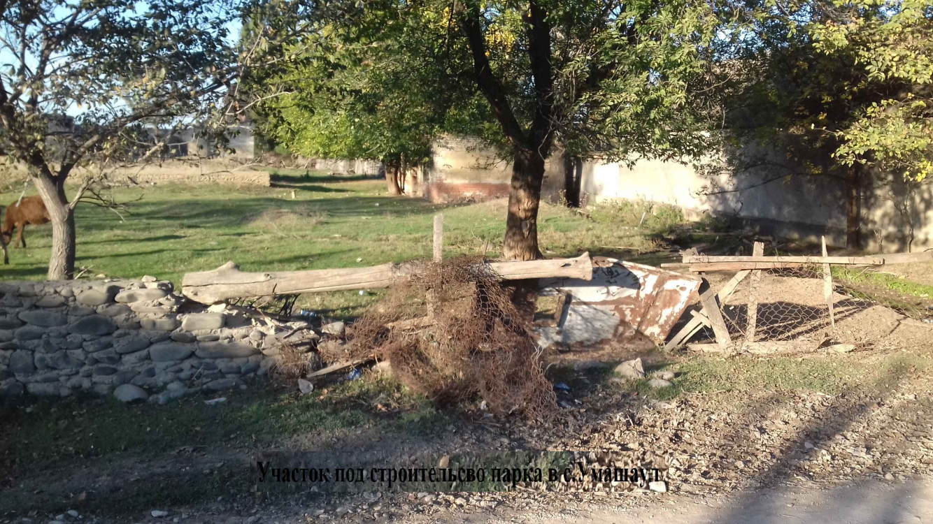
Участок под строительство парка в с. Умашаул.