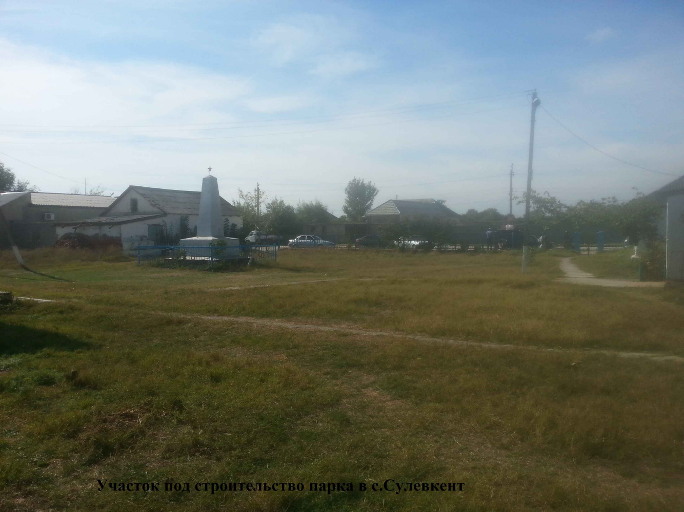
Участок под строительство парка в с.Сулевкент