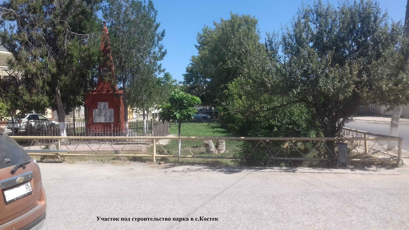
Участок под строительство парка в с.Костек